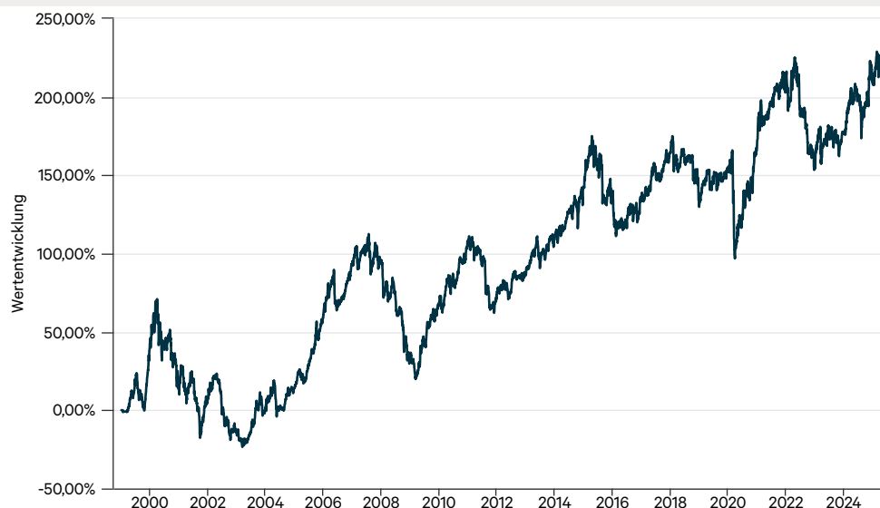
— C-QUADRAT ARTS Best Momentum T