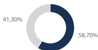
Die 10 größten Positionen in Prozent vom Gesamtportfolio

Die Top 10 Holdings werden in Prozent des Gesamtnettovermögens angegeben. Die Zusammensetzung des Fonds kann sich jederzeit ändern. Hinweise auf bestimmte Wertpapiere sollten nicht als Empfehlung zum Kauf oder Verkauf oder als Aussage über deren Gewinnpotenzial verstanden werden.