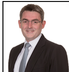
Alasdair Ross Seit Juni 14

Verwaltungsgesellschaft: Threadneedle Man. Lux. S.A. Umbrella-Fonds: Columbia Threadneedle (Lux) I SFDR-Kategorie: Artikel 8 Auflegungsdatum des Fonds: 17.06.14 Index: Bloomberg Global Aggregate - Corporates (USD Hedged) Vergleichsgruppe: Morningstar Category Global Corporate Bond - USD Hedged Fondswährung: USD Fondsdomizil: Luxemburg Fondsvolumen: $1.040,2m Anzahl der Wertpapiere: 397 Preis der Anteilsklasse: 13,3247 Alle Angaben in USD