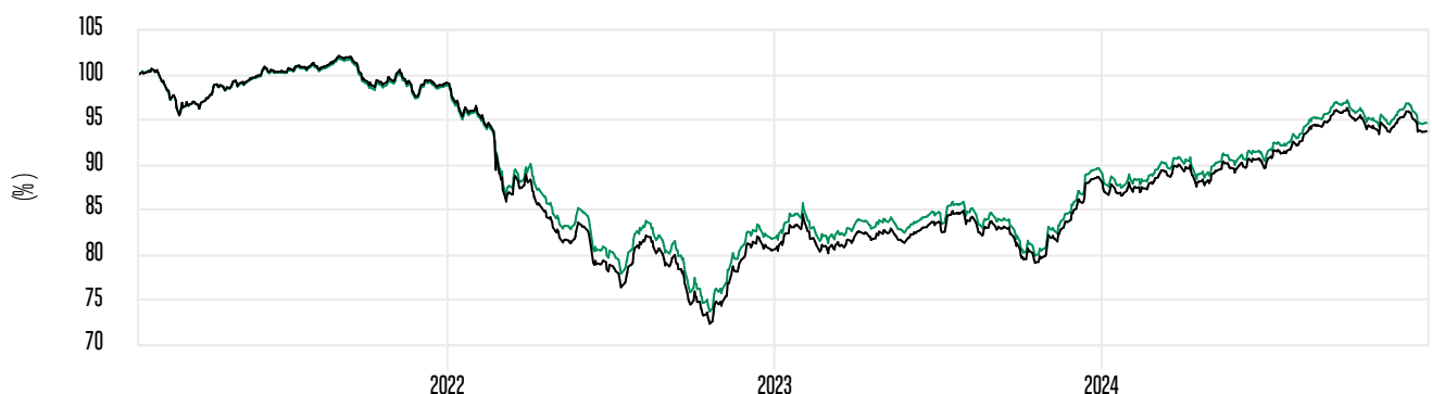
Kumulierte Wertentwicklung per 31.12.2024 (in %)