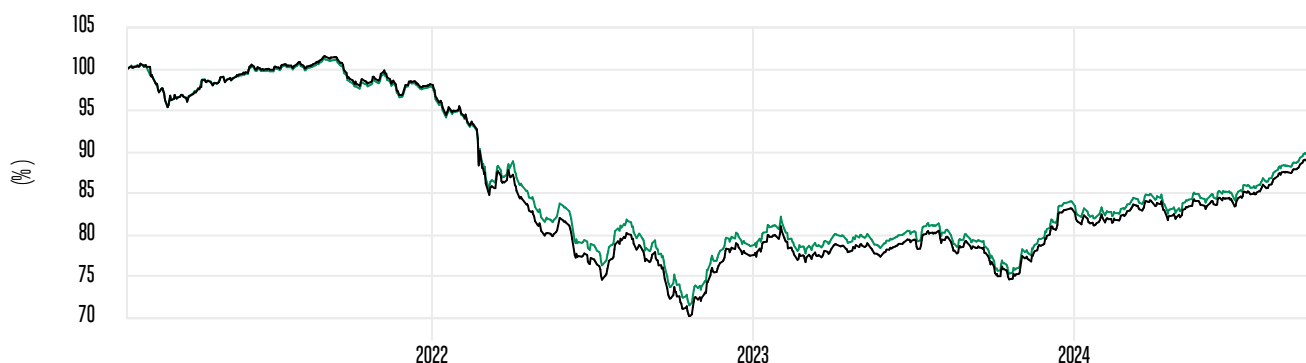
Kumulierte Wertentwicklung per 30.09.2024 (in %)