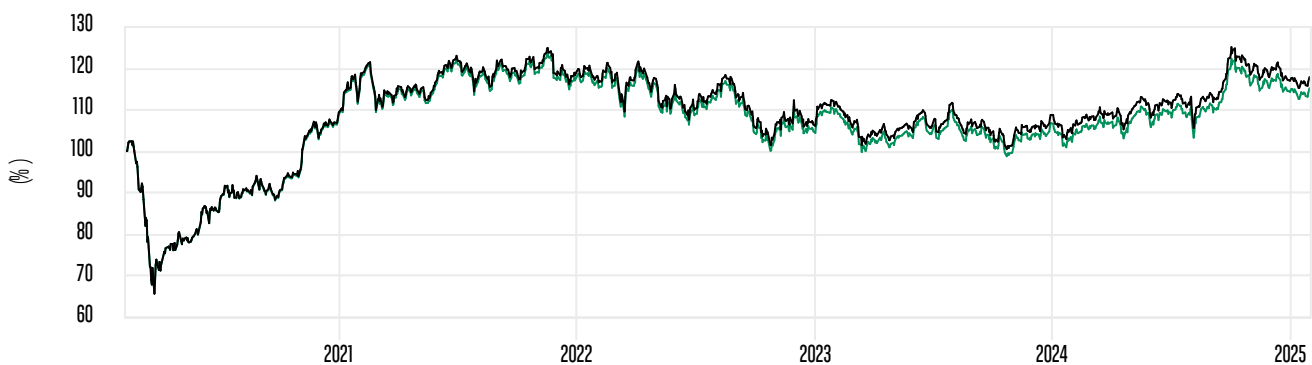
Kumulierte Wertentwicklung per 31.01.2025 (in %)