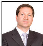
George Gosden Seit Jan 13

Verwaltungsgesellschaft: Threadneedle Man. Lux. S.A. Umbrella-Fonds: Columbia Threadneedle (Lux) I SFDR-Kategorie: Artikel 6 Auflegungsdatum des Fonds: 06.04.99