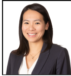
Tammie Tang Seit Dez 23

Verwaltungsgesellschaft: Threadneedle Man. Lux. S.A. Umbrella-Fonds: Columbia Threadneedle (Lux) I SFDR-Kategorie: Artikel 9 Auflegungsdatum des Fonds: 05.12.23 Fonds: - Index: - Vergleichsgruppe: - Fondswährung: USD Fondsdomizil: Luxemburg Ex-Dividendendatum: annual Zahlungsdatum: annual Fondsvolumen: €7,1m Anzahl der Wertpapiere: 113 Preis der Anteilsklasse: 10,4475 Alle Angaben in EUR